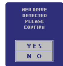
Keine Software oder Treiber notwendig Mac-, Linux- und Windows-kompatibel