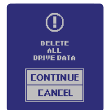
Selbsterstörungs-Modus (Auf Wunsch einstellbar)