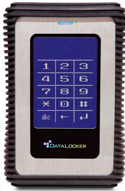
Zwei-Faktor-Authentifizierung durch RFID-Karte (bei der RFID-Version)