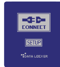
USB 3.0 Schnittstelle (USB 2.0 kompatibel)

verfügbar mit 320GB, 640GB und 1TB Festplatte, sowie 128GB und 256GB MLC SSD